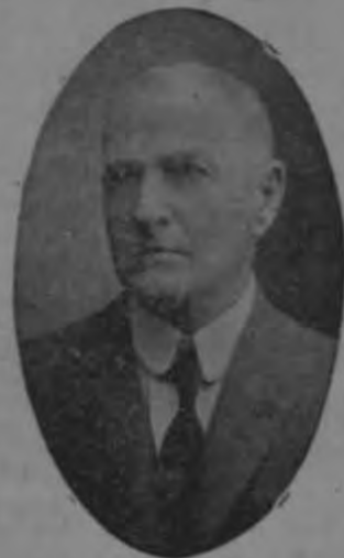
General don Juan Bautista Quirós

Muy animado y complacido se mostró el señor Ex-Presidente al recibir la visita del Excmo. Sr. Nuncio Apostólico, quien al retirarse bendijo al