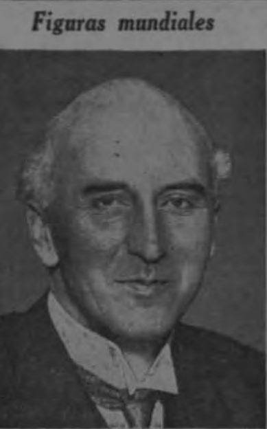
Sir JOHN SIMON Secretario de Relaciones de la Gran Bretaña